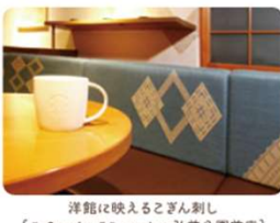
洋館に映えるござん刺し [スターバックス コーヒー 弘前公園前店]