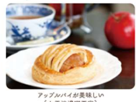
アップルパイが美味しい [大正浪漫喫茶室]