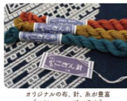
オリジナルの布、針、糸が豊富 [ホビishop つきや]