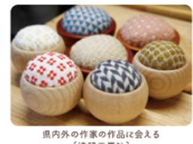
県内外の作家の作品に会える [津軽工房社]